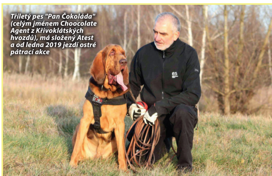
Tříletý pes "Pan Čokoláda" (celým jménem Choocolate Agent z Křivoklátských hvozdů), má složený Atest a od ledna 2019 jezdí ostré pátrací akce