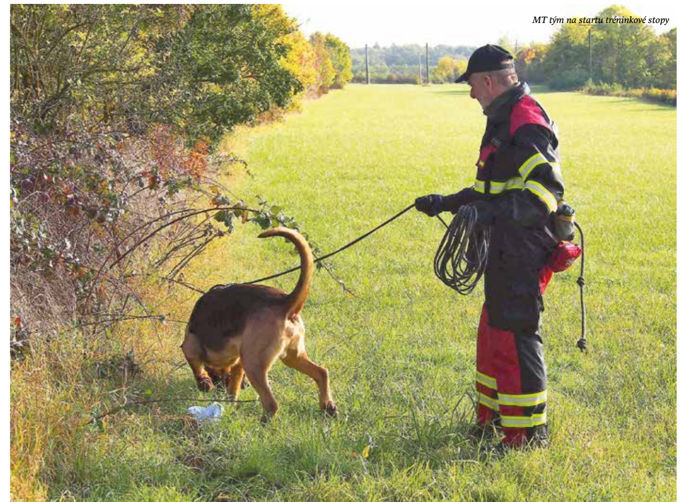
MT tým na startu tréninkové stopy

Kde je tedy problém? Má-li pes samostatně, podle svých nejlepších schopností co nejrychleji najít hledanou osobu, prostě všechna naše, lidská pravidla, podmínky, nařízení, požadavky, by úplně akceptovat neměl. Otázka totiž zní: Jak můžeme stanovit pravidla a předpisy na něco, čemu prakticky nerozumíme, co nemůžeme změřit, ověřit, potvrdit, ukázat, ohodnotit. Existuje něco jako praxe pachu? Zatím je to pořád nauka o teorii pachu. Tedy pouze tušíme, jak to ve skutečnosti může fungovat, ale prakticky to neumíme ověřit. Dobrý stopař, při hledání pachové stopy, hlavně používá své nezpochybnitelné genetické předpoklady, schopnosti a dovednosti získané