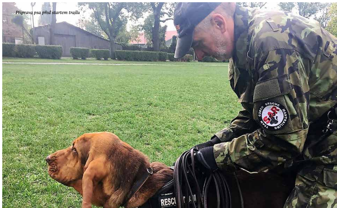
Příprava psa před startem trailu

dlouholetým řešením mnoha různých situací, do kterých ho v tréninku stavíme a podmínky pro něj jsou pak jednoduché. Pokud se tady někde pachové částice hledané osoby ještě nachází a ty mi řekneš, koho hledáme, a já chci, tak ti toho človíčka najdu. Jak? To je můj problém. Nech to na mě, stejně tomu nerozumíš.