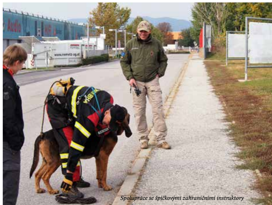
Spolupráce se špičkovými zahraničními instruktory

Ale kdo, kromě psa ví, že pachové částice ještě v prostoru jsou? Kdo odhadne podíl AirScentingu, shody